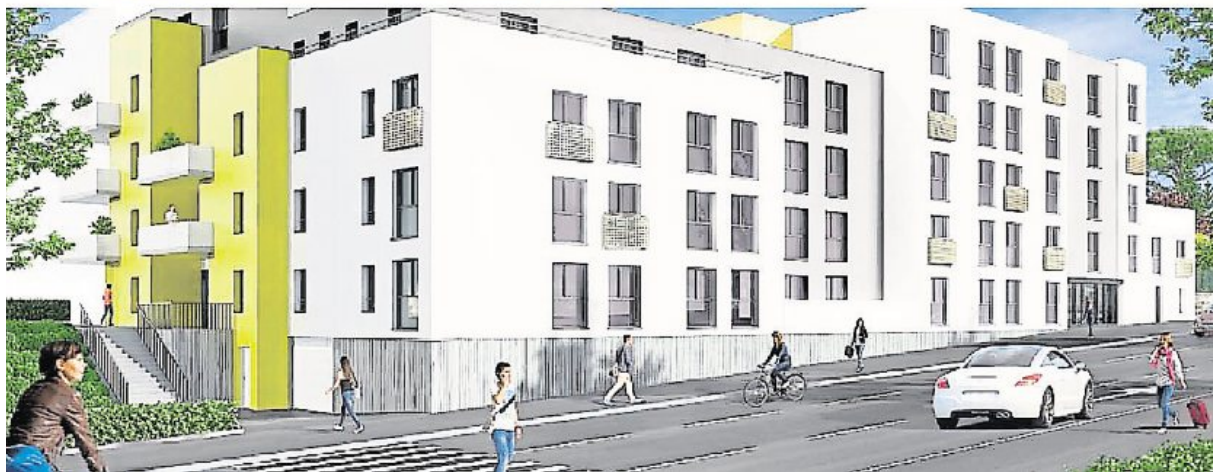
Rue du Moulin-au-Roy (en haut), la construction de 89 logements a débuté. Rue de la Délivrande (en bas), 121 logements sont en construction, presque en face du lycée Laplace.

dants et un T2 pour le gardien de la résidence. Celle-ci sera gérée par la société Néméa.