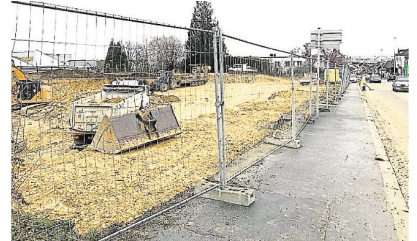
Un bunker allemand avait été mis au jour lors d'un chantier près du centre de Caen, l'an passé. Il a été recouvert de terre, début mars, un an après.